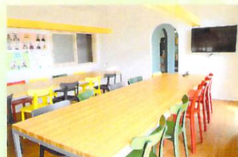
紫雲寮 ダイニング