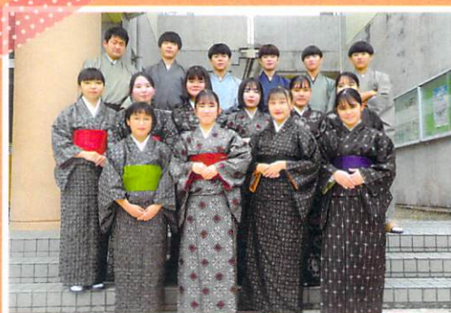
大島紬に関する体験学習