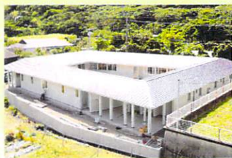
清雲寮(女子寮) 令和2年4月完成