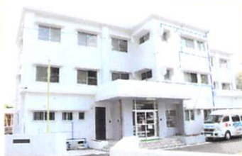
紫雲寮(男子寮) 平成31年3月完成