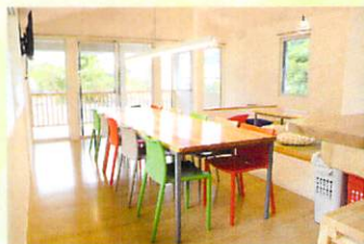
清雲寮 ダイニング